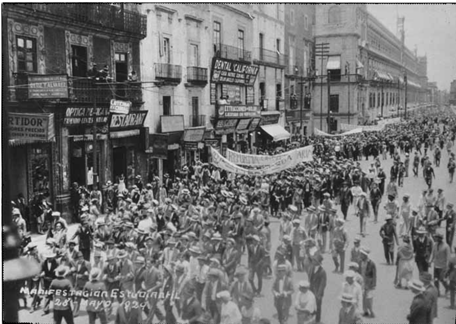
Manifestación del 28 de mayo [fotografía], 1929