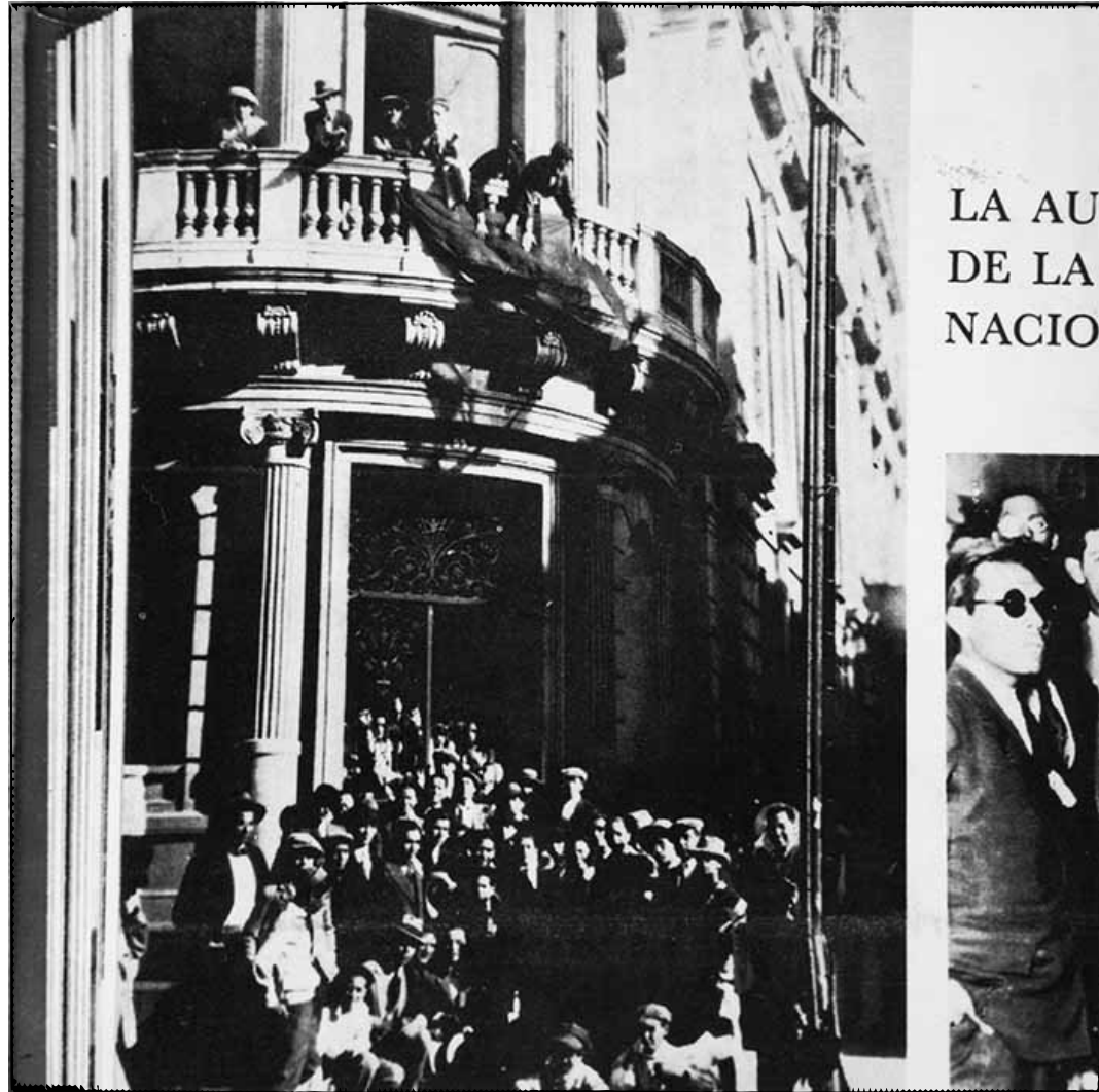
Desocupación de Rectoría [fotografía], 1929