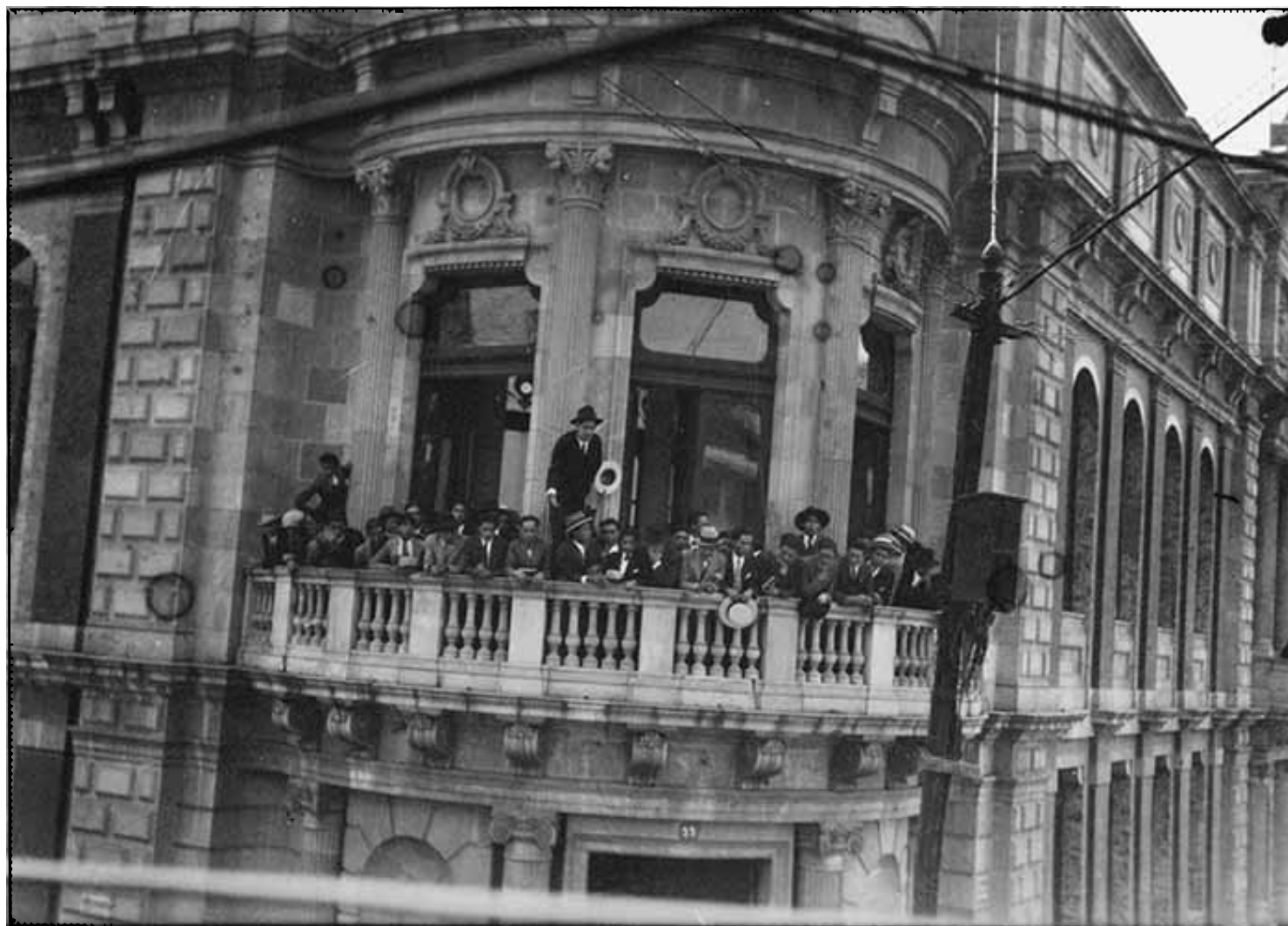
Estudiantes en Rectoría [fotografía], 1929