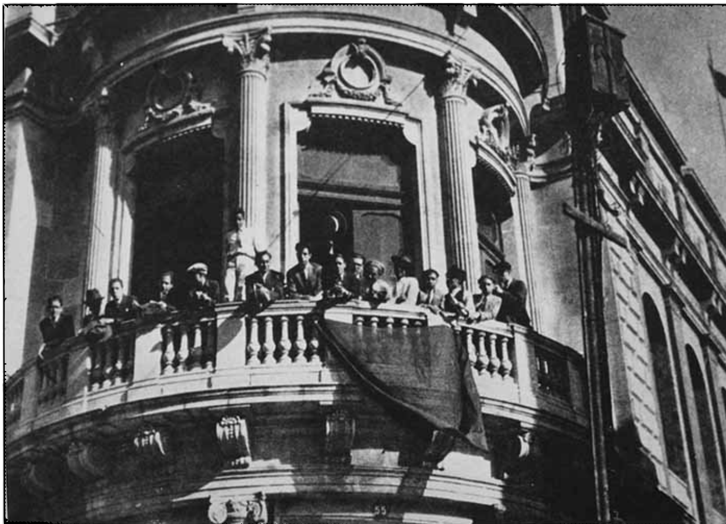
Estudiantes cuelgan bandera de huelga en Rectoría [fotografía], 1929